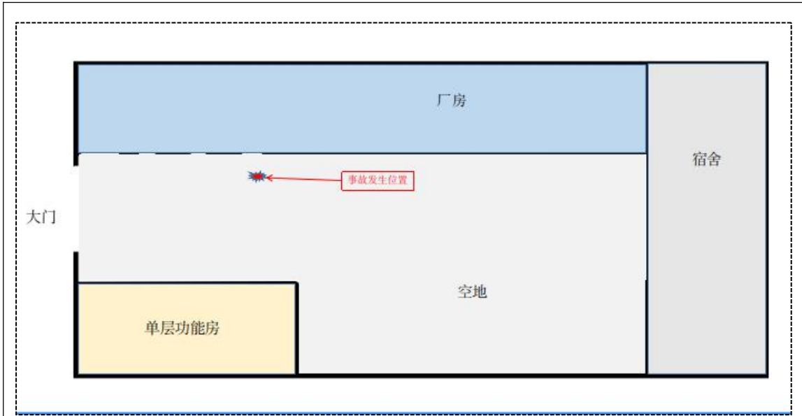
图 2 事发位置平面图