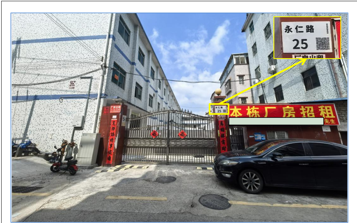
图 1 永仁路 25 号

事发位置位于厂房一楼第三窗户外侧（图 2）。现场架设有一个双层门式脚手架，架体所在地面为混凝土硬化地面，地面平整（图 3）。脚手架上方有一个未完全拆除的旧雨棚，雨棚与二楼窗户下沿齐平；雨棚支架左侧与墙体连结固定完好，右侧支架螺栓已拆除，下垂架在脚手架上。作业平台位于脚手架第二层，平台上脚手板未满铺（仅铺设了一块脚手板），脚手架二层护栏四周有两侧未设置水平防护栏杆。经测量：涉事脚手架长、宽、高分别为 1.85 米、0.95 米、3.96 米，作业平台高为 2.45 米，雨棚原始安装高度为 5.12 米。坠落点在脚手架右前侧，地面留有大量血迹。事故现场未见安全帽和安全带（图 4、图 5）。