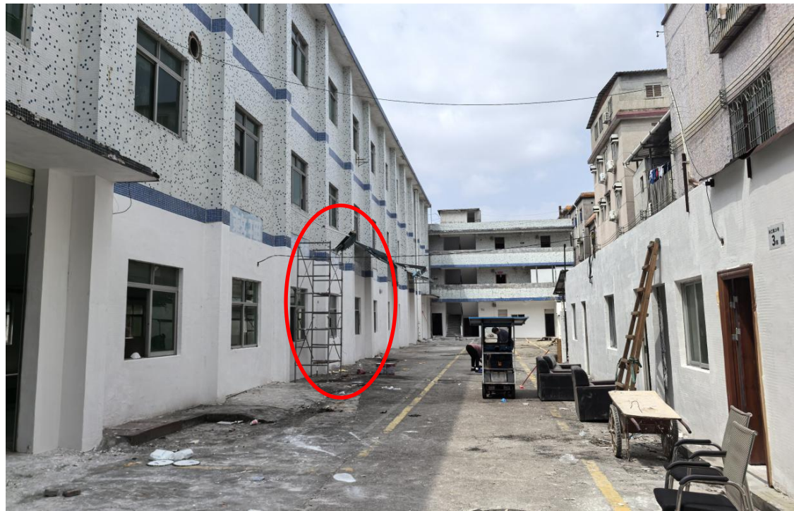
图 3 事发现场整体情况