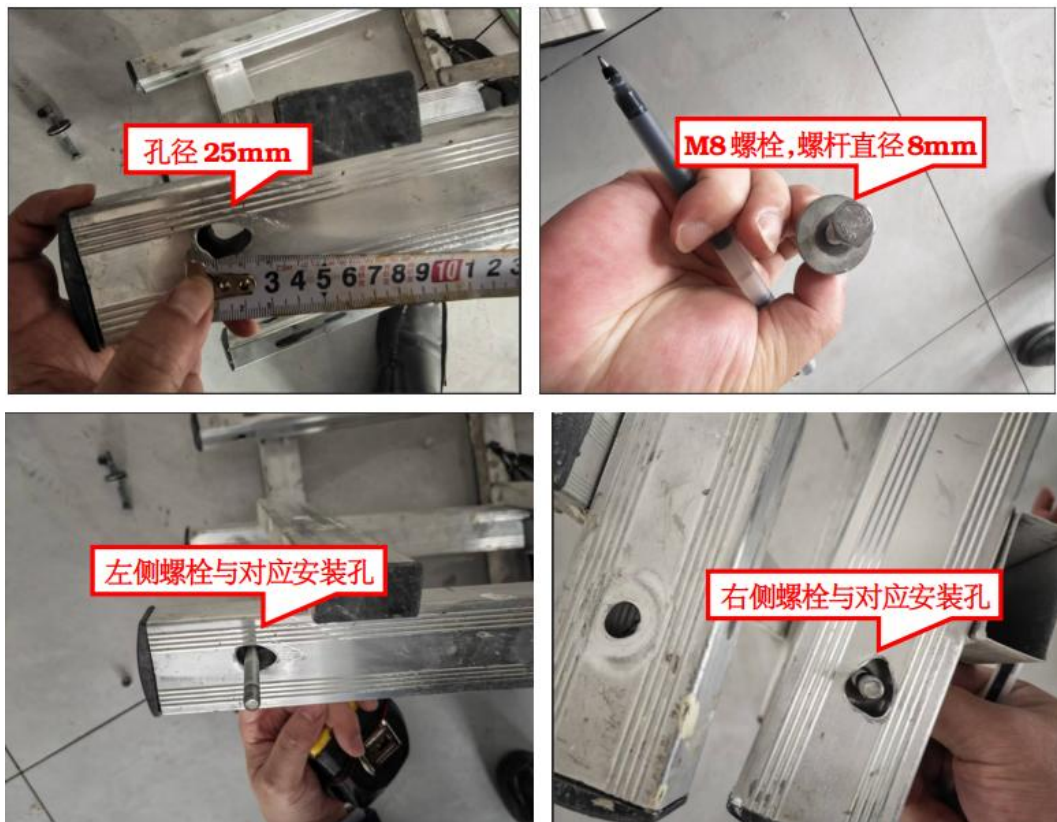
图 7 涉事人字梯铰链螺栓情况