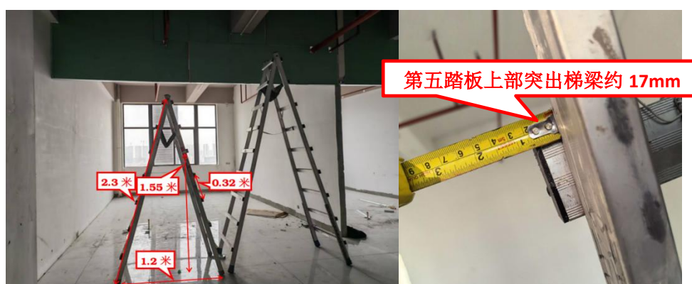
图 6 涉事人字梯整体情况及第五踏步情况

距约 1.2 米，顶部安装孔磨损，踏步中心间距约 0.32 米，陈某兵跌落前所站立的第五踏步距离地面垂直高度为 1.55 米，踏步两端伸出梯梁约 17mm（见图 6），梯梁之间有限制开合角度的绷带。踏步与梯梁使用焊接工艺连接，踏步面可见防滑压纹，梯脚有防滑橡胶套。现场未见安全帽（事发后工人将安全帽带走），无明显血迹。