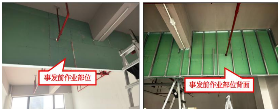
图 5 涉事隔间隔板情况

3. 现场共有一高一矮两部铝合金质人字梯，放置在靠近西北侧墙边的地上，高梯子长 2.9 米，地面为瓷砖材质，无凸起物及其他异物。涉事梯子为矮梯子，其长 2.3 米，工作状态时梯脚踏