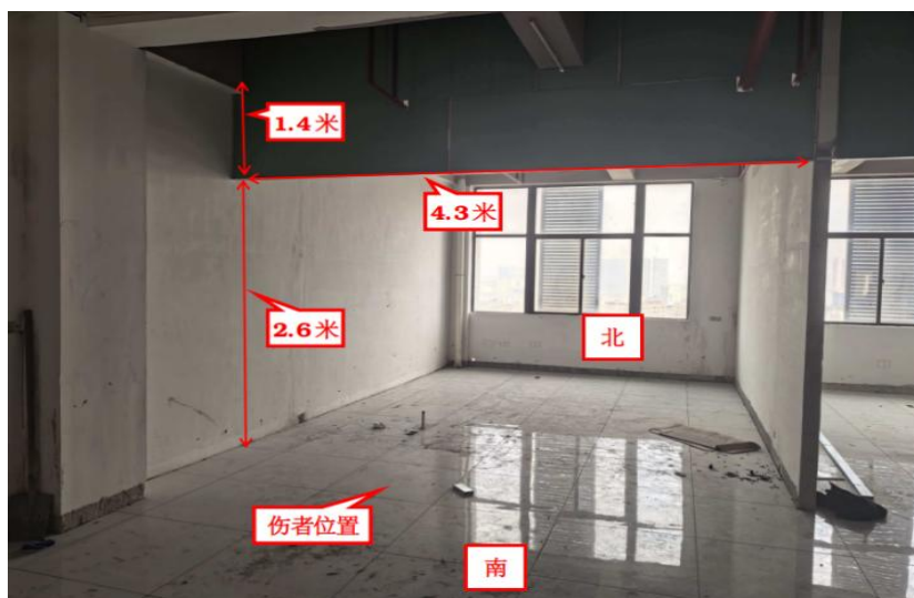
图 4 涉事隔间情况

2. 事发点位于西北角的隔间处，隔间宽 4.3 米，高 4 米，靠南侧的墙体还未施工，该面墙体顶部使用金属龙骨加石膏板做了一面隔板，隔板高 1.4 米，底部离地面高度为 2.6 米。事发前伤者站在较矮人字梯上紧固石膏板螺丝（见图 4、图 5）。